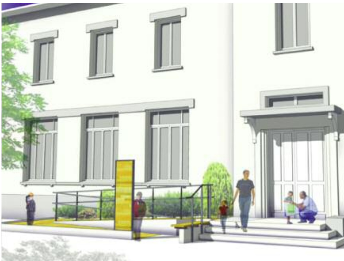
Les travaux se dérouleront en trois phases et prendront fin en 2017.