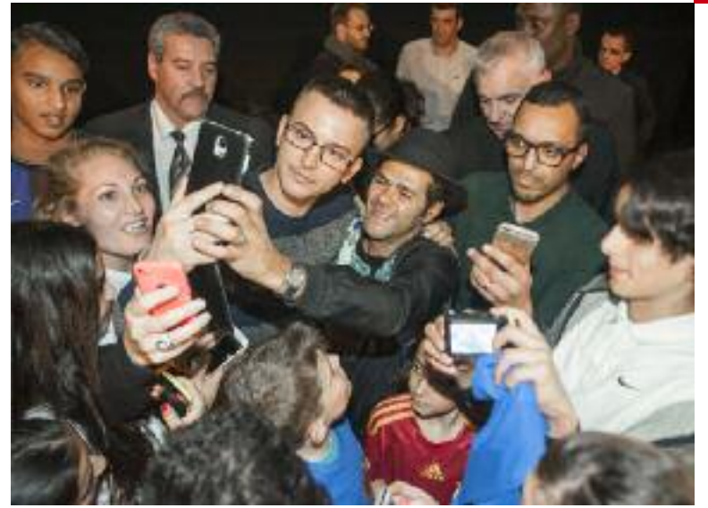
Salle comble pour Jamel Debbouze au Pathé Carré de Soie Nombreux étaient les spectateurs ne pas vouloir le laisser filer sans faire un petit selfie avec lui. Jeudi 26 mars, Jamel Debbouze a fait le plein pour la présentation de son nouveau film, "Pourquoi j'ai pas mangé mon père" réalisé en motion capture. "Ce film, c'est le fruit de sept ans de travail. C'est énorme", a confié l'acteur et réalisateur à une salle pleine à craquer. Jamel Debbouze a écrit ce film, basé sur un livre de Roy Lewis, pour inculquer des valeurs à ses enfants. "Des choses nobles comme l'amour et la fraternité, et des choses plus dures aussi. Leur dire qu'on ne peut pas ne pas aimer quelqu'un parce qu'il est différent."