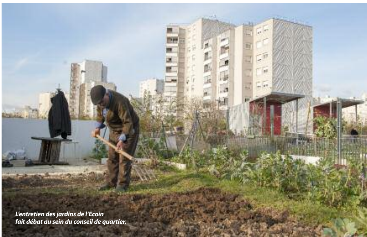
L'entretien des jardins de l'Ecoin fait débat au sein du conseil de quartier.

Le conseil des quartiers Est a enfin élu son bureau, constitué trois commissions et a obtenu une salle à Carco.