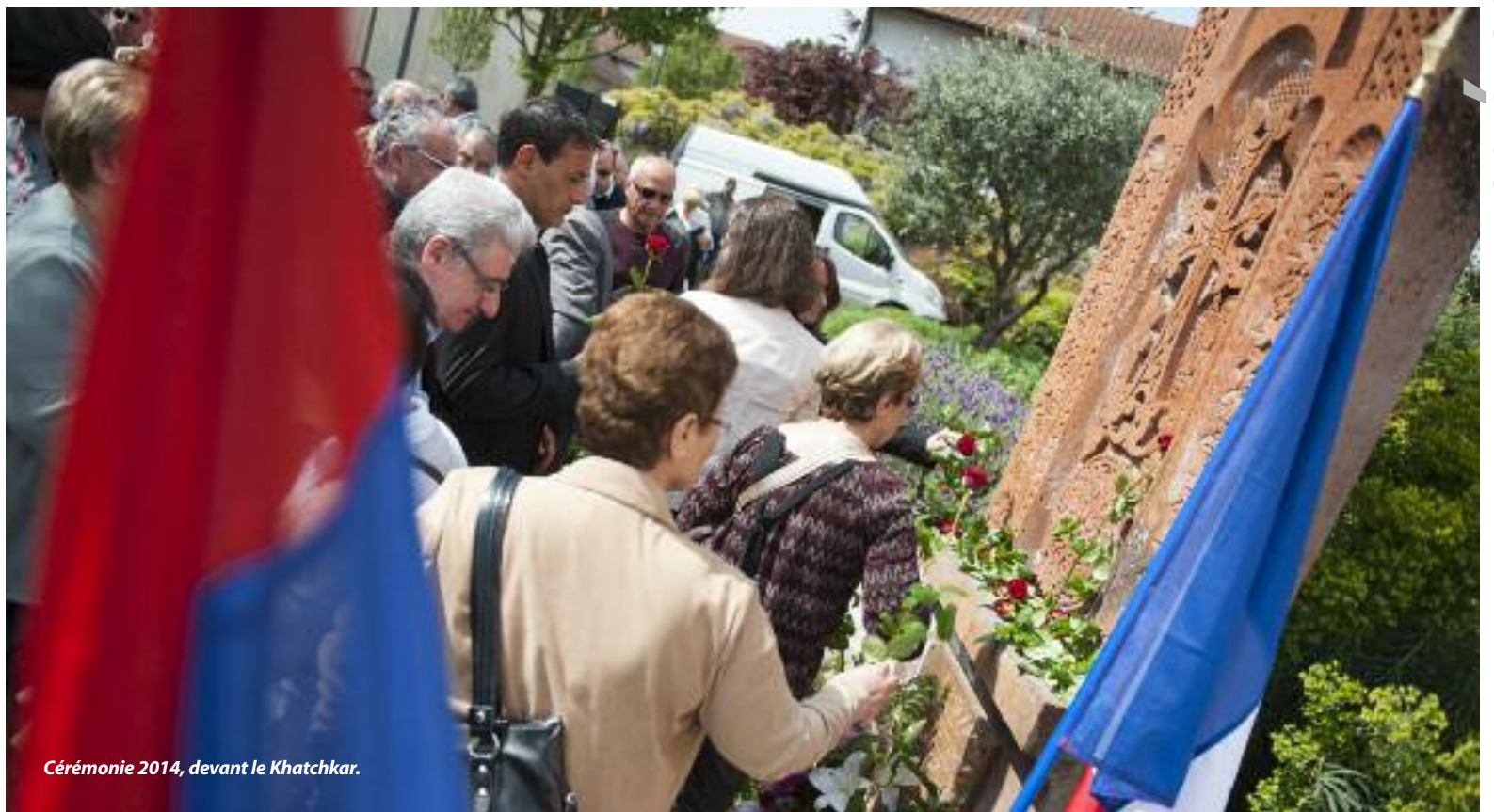
Cérémonie 2014, devant le Khatchkar.