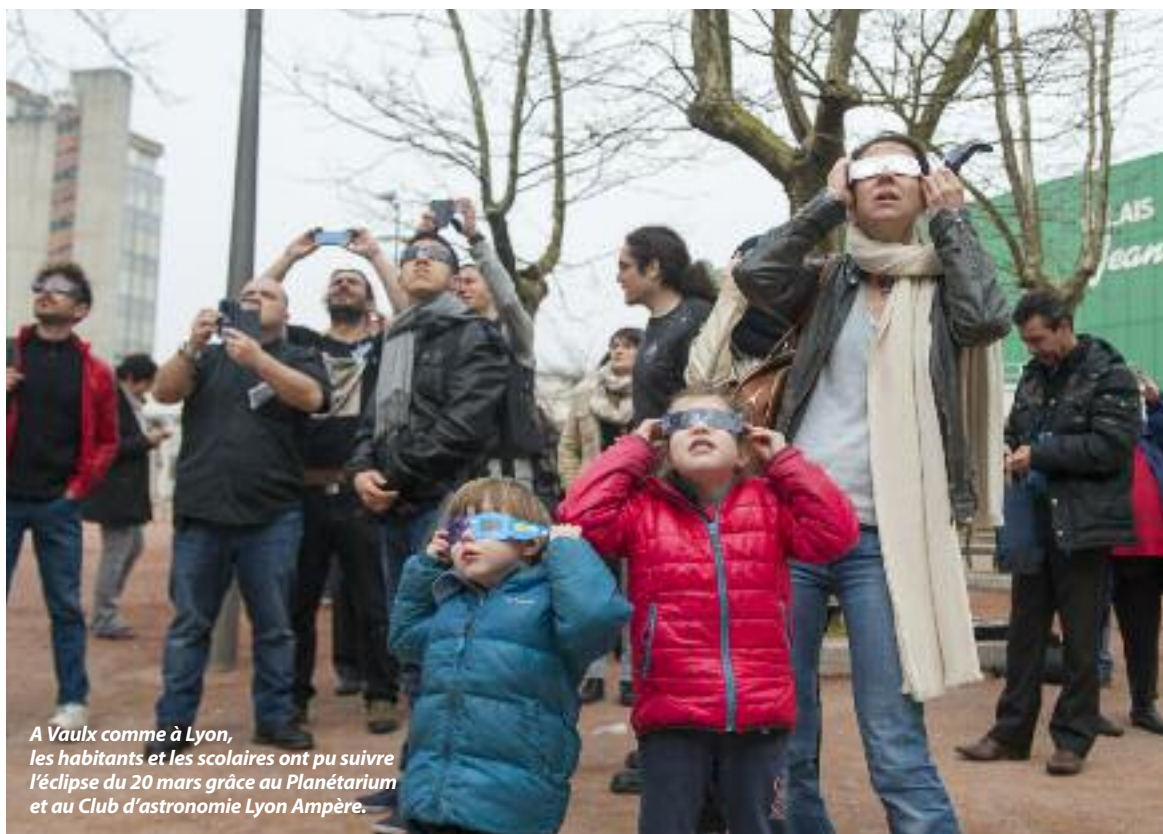
A Vaulx comme à Lyon, les habitants et les scolaires ont pu suivre l'éclipse du 20 mars grâce au Planétarium et au Club d'astronomie Lyon Ampère.

Pleins feux sur la Biennale du ciel et de l'espace "Oufs d'Astro" qui aura lieu du 7 au 26 avril, et sur l'Année internationale de la Lumière pour laquelle le Planétarium vous réserve quelques surprises. Fiat lux !