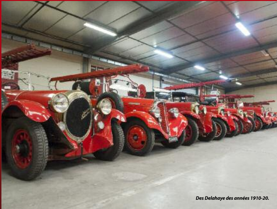
Des Delahaye des années 1910-20.

Vermillon, ponceau, carmin, vermillon, écarlate... Ce ne sont pas moins de 150 véhicules étincelants et sagement alignés qui retracent la grande histoire des soldats du feu du 19 e siècle à nos jours, dans un impressionnant camaïeu de rouge. "Nous sommes un musée de métier dans lequel la mémoire se transmet", note la directrice qui peut compter sur une armée de bénévoles, pour la plupart d'anciens pompiers,